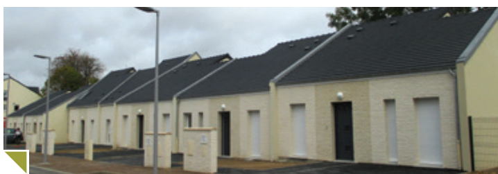
CHEMIN DE LA CHAUSSÉE « Le clos de Longpré » 33 logements 20 logements collectifs et 13 logements individuels du Type 2 au type 5