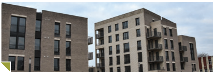
GARE LA VALLÉE « Le beffroi des hortillons » 44 logements collectifs du studio au Type 4

L'OPAC d'Amiens poursuit également ses programmes de construction, près de 100 nouveaux logements verront le jour cette année.